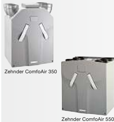
Zehnder ComfoAir 350

Zehnder ComfoAir 350 oder ZehnderComfoAir 550 Kompaktes, leistungsstarkes und ruhiges Wärmerückgewinnungsgerät mit einem hohen Wirkungsgrad von ~ 95% dank sehr effizienten Kreuzgegenstrom-Wärmetauschern.