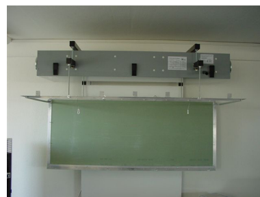
ComfoAir Flat 150 Revisionsklappe geöffnet