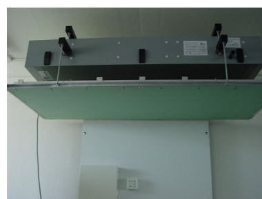
ComfoAir Flat 150 mit Revisionsklappe